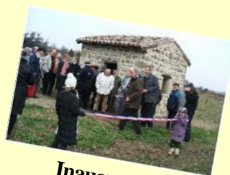
Inauguration musée de l'agriculture