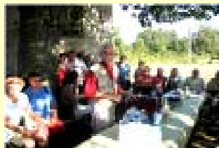
Inauguration musée de la vigne