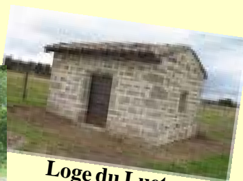
Loge du Luet