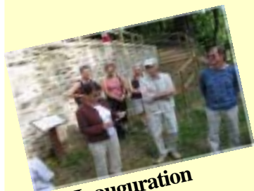
Inauguration musée de l'eau