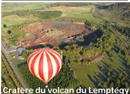
Cratère du volcan du Lemptégy