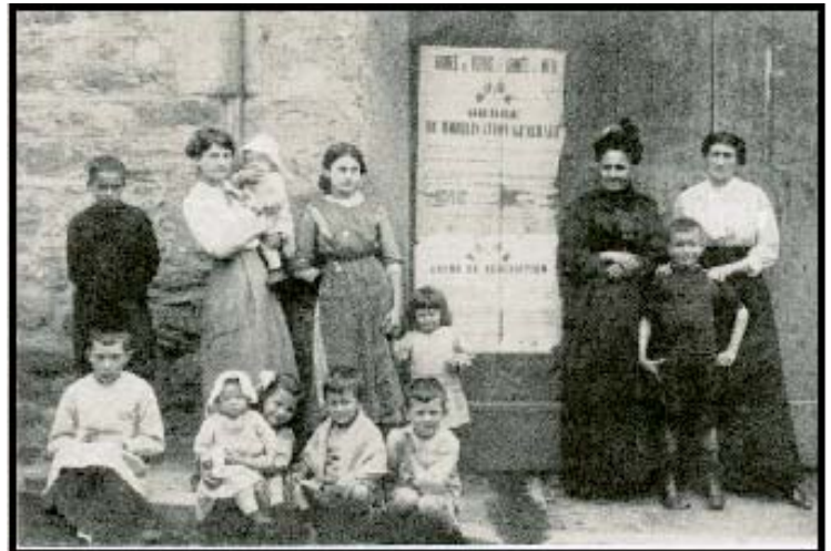
La vie à Mornant en ce temps la

On recherche encore des témoignages, lettres, photos, objets divers