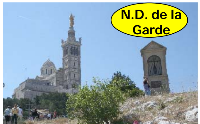
N.D. de la Garde