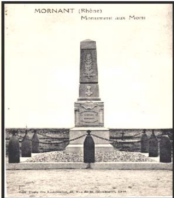
Un hommage à nos 64 poilus morts pour la France