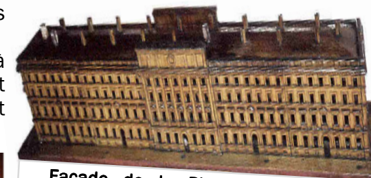
Façade de la Place BELLECOUR

Ces maquettes vous feront voyager et rêver.